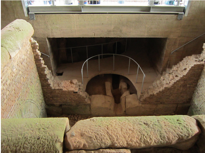
Brunnenstube "Klausbrunnen" in Mechernich-Kallmuth (2013)