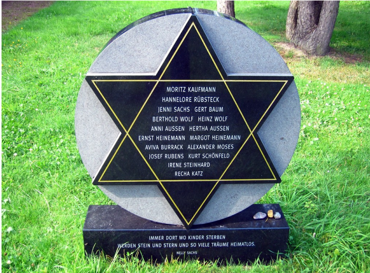
Vorderseite des Gedenksteins auf dem jüdischen Friedhof in Wevelinghoven (2014).