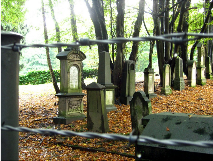
Jüdischer Friedhof auf dem Parkfriedhof in Essen-Huttrop, Parzelle mit den Grabsteinen des älteren Friedhofs in der Lazarettstrasse (2011).

Fachsicht(en): Kulturlandschaftspflege, Landeskunde