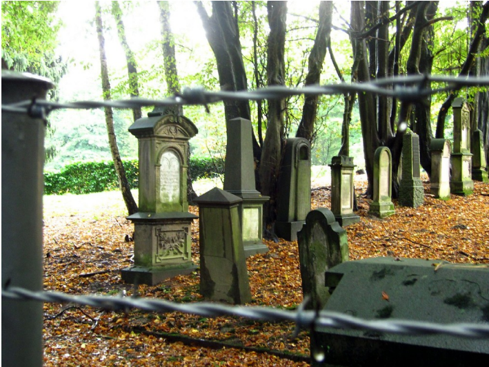
Jüdischer Friedhof auf dem Parkfriedhof in Essen-Huttrop, Parzelle mit den Grabsteinen des älteren Friedhofs in der Lazarettstrasse (2011).

Fachsicht(en): Kulturlandschaftspflege, Landeskunde