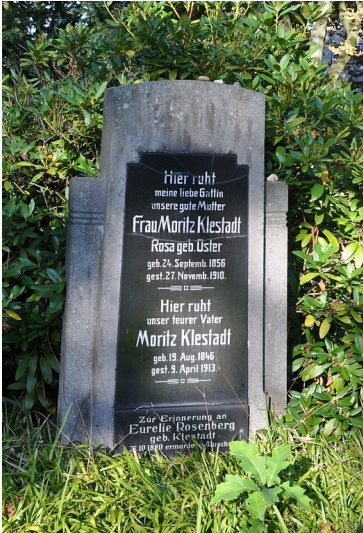
Grabstein auf dem jüdischen Friedhofs auf dem kommunalen Friedhof Sternbuschweg (2016).