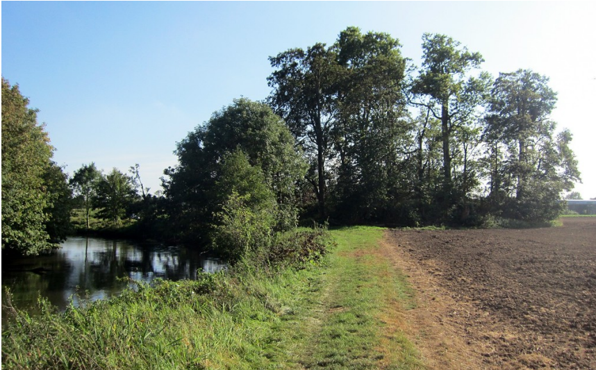
Der unmittelbar an der Erft gelegene Mottenhügel Burg Hombröich aus nördlicher Richtung (2014).