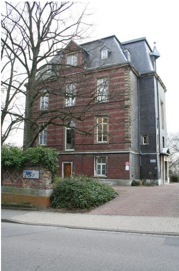
Die Villa Monheim, RWTH Institut für Werkstoffe der Elektrotechnik, Muffeter Weg in Aachen (2011).