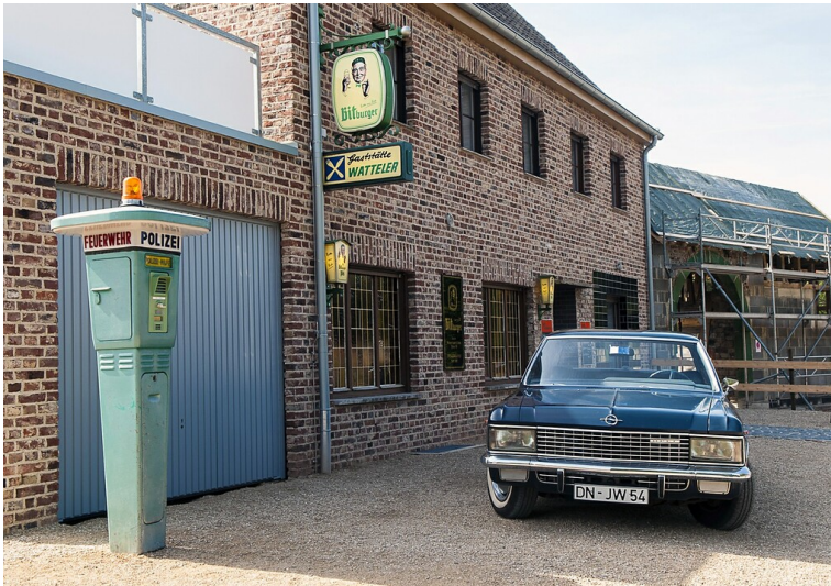
Der "Marktplatz Rheinland" im LVR-Freilichtmuseum Kommern (2022). Im Bild die Gaststätte Watteler im Stil der 1950/70er-Jahre, davor eine zeittypische Notrufsäule und ein Opel der 1964-1968 produzierten Baureihe KAD (Serie A).