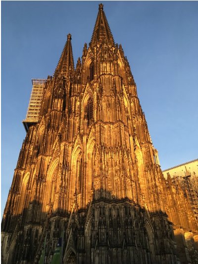
Die Türme des Kölner Doms von Südwesten aus gesehen in der Abendsonne (2018)