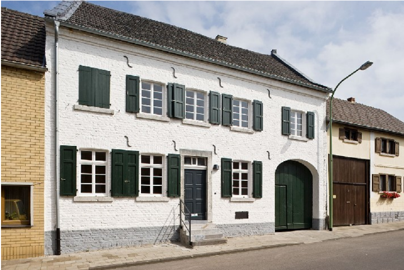
Früheres Wohnhaus der jüdischen Familie Ullmann