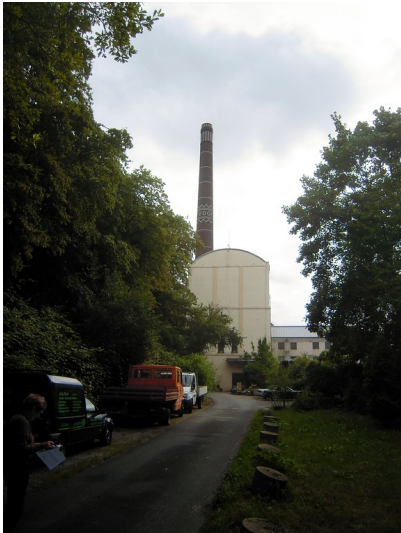
Zufahrt zur Horster Mühle in Essen und Blick auf das heutige Kraftwerksgebäude (2016)