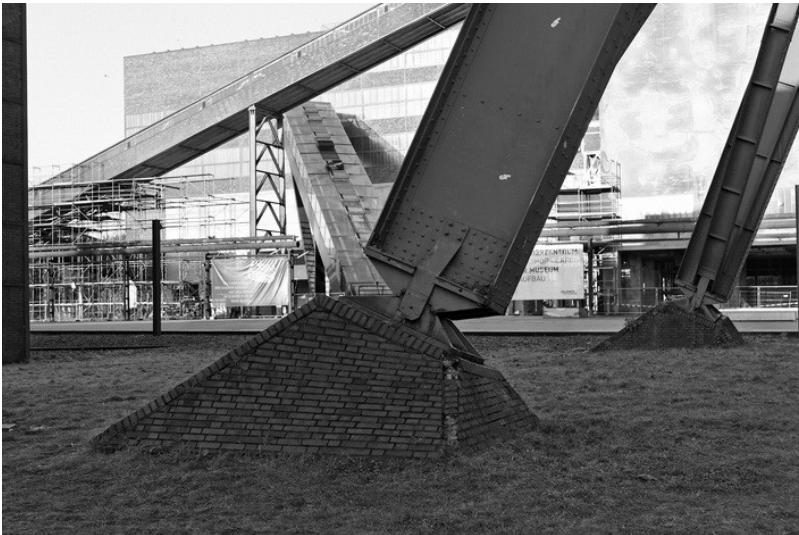
Detailaufnahme der Fundamente und der Widerlager des Fördergerüsts von Zollverein 12 (2008).