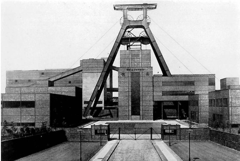
Historische Aufnahme der Anlagen von Schacht 12 der Zeche Zollverein in Essen (um 1930)