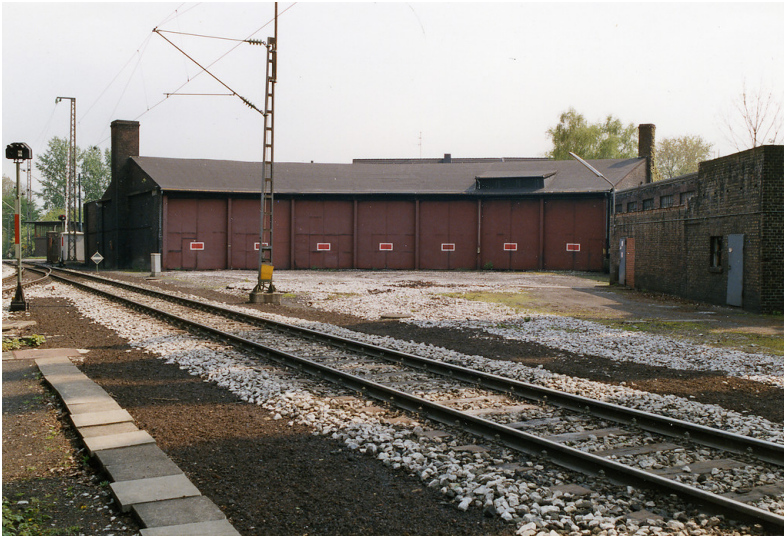
Außenansicht des Lokschuppens der Zeche Zollverein, Schächte 1-2-8 in Essen