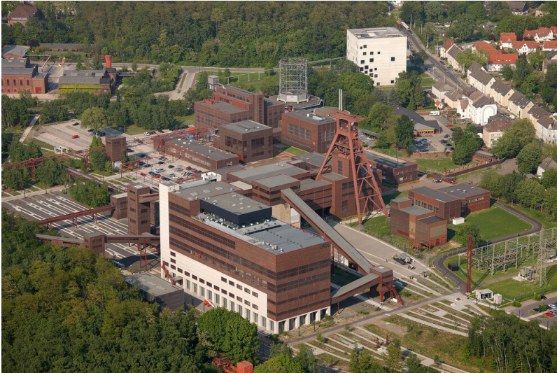
Luftbild Gesamtübersicht Zeche Zollverein Essen (2011)