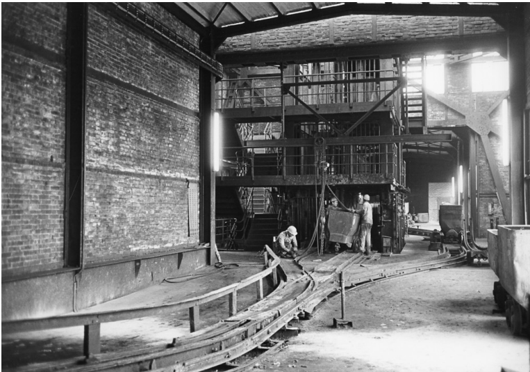
Zeche Zollverein, Schächte 1-2-8, Wagenumlauf