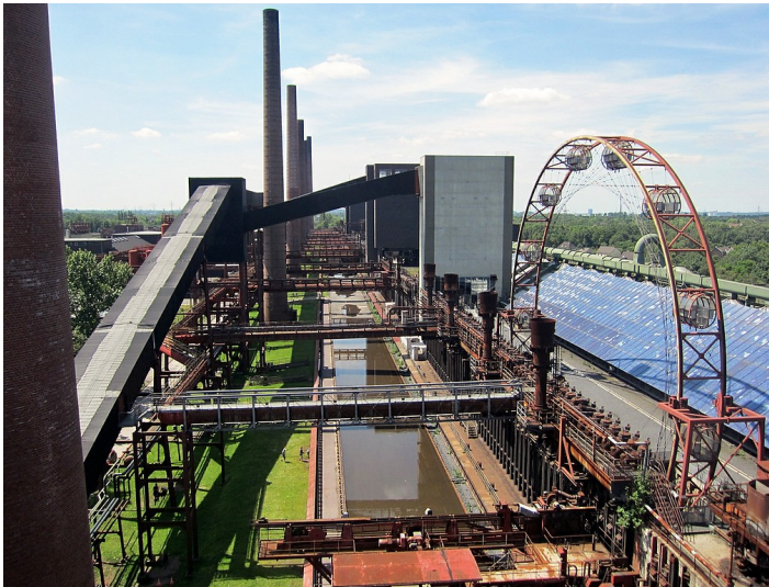
Blick über einen Teil der Anlage der Kokerei Zollverein in Essen-Stoppenberg (2014). Ganz im Hintergrund rechts der Gasometer Oberhausen.