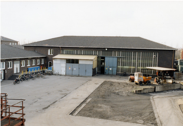
Werkstatt und Magazin der Kokerei Zollverein in Essen