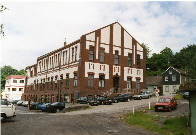
Verwaltungs- und Kauengebäude der Zeche Viktoria in Essen