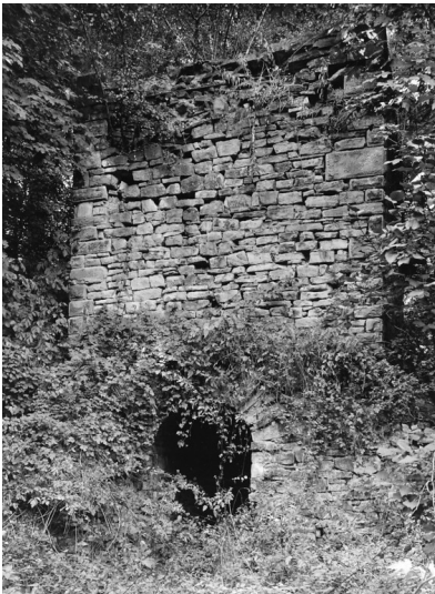
Der Wetterkamin der Zeche Viktoria in Essen Byfang