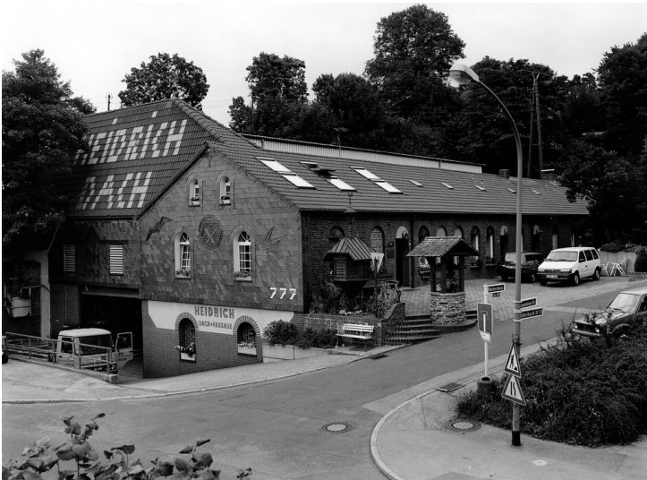
Zechenhaus der Zeche Prinz Wilhelm in Essen