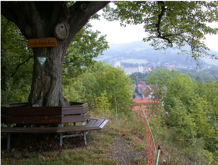
Aussichtspunkt Halberg in Neumorschen mit Lindenbaum (2009)