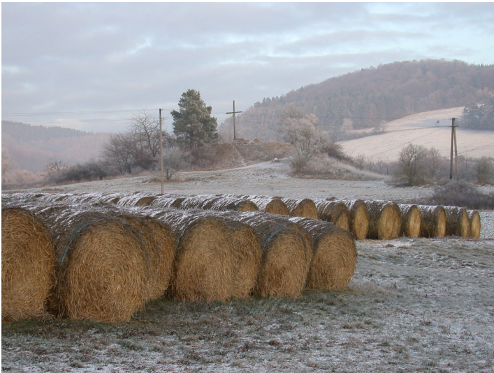
Kapell-Berg Altmorschen, Gemeinde Morschen (2009)