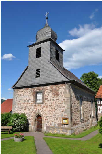
Evangelische Pfarrkirche in Konnefeld, Gemeinde Morschen (2012)