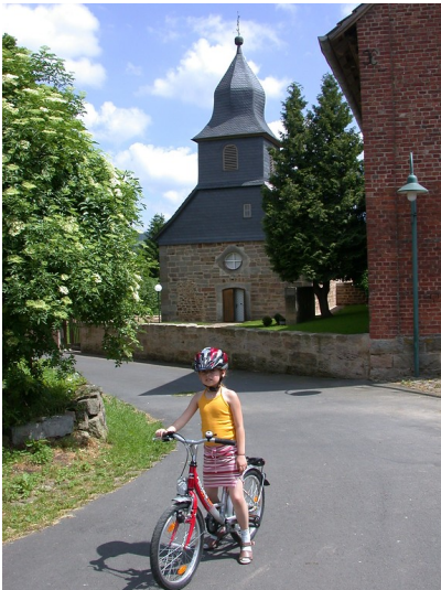
Evangelische Pfarrkirche in Binsförfth, Gemeinde Morschen (2009)

Schlagwörter: Kirchengebäude , Kirchhof , Friedhofsmauer , Grabstein , Taufbecken Fachsicht(en): Kulturlandschaftspflege, Archäologie, Denkmalpflege, Landeskunde Gemeinde(n): Morschen Kreis(e): Schwalm-Eder-Kreis Bundesland: Hessen