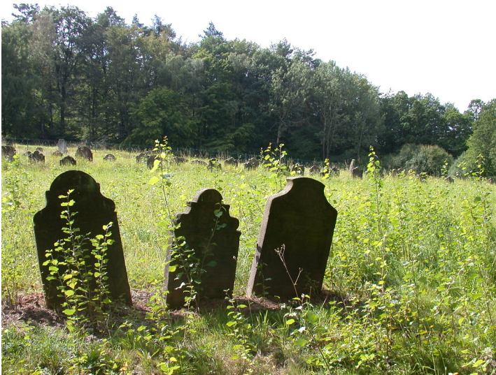
Judenfriedhof in Binsförth, Gemeinde Morschen (2009)