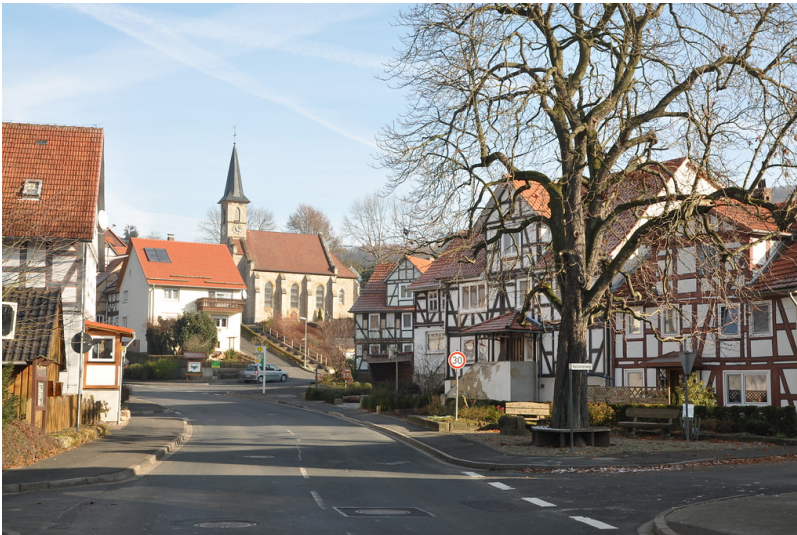
Ortsmitte Eubach, Gemeinde Morschen (2011)