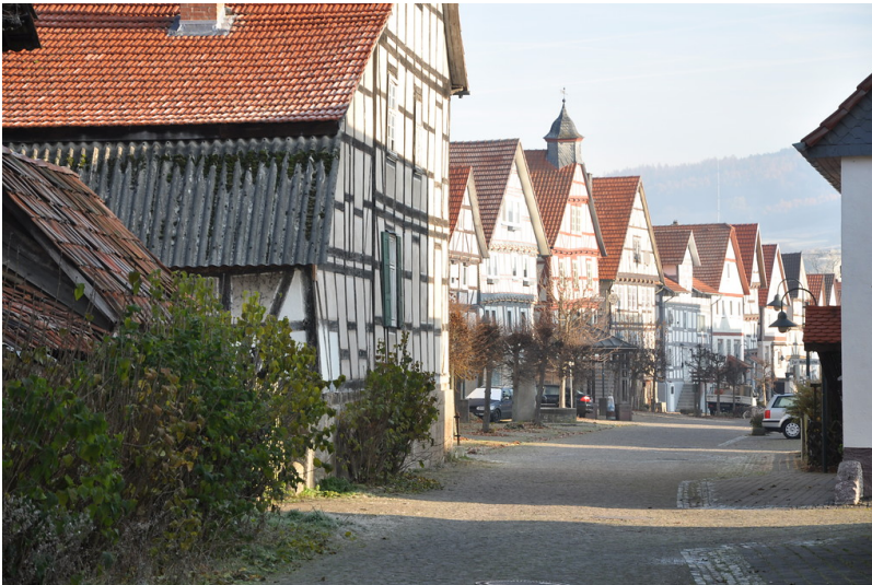
Marktstraße Neumorschen, Gemeinde Morschen (2011)