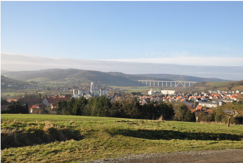
Altmorschen im Fuldataal, Gemeinde Morschen, in Nordhessen (2012)