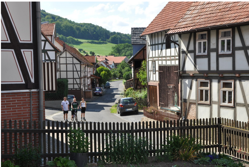
Neumorschener Straße in Konnefeld, Gemeinde Morschen (2012)