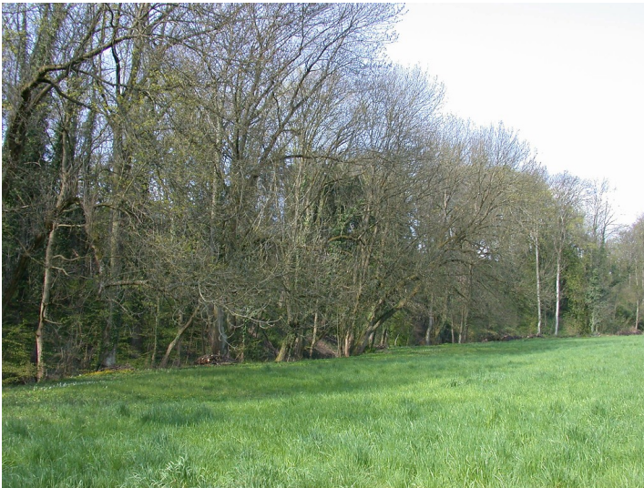
Das Rheingauer Gebück im Walluftal