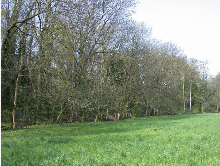
Das Rheingauer Gebück im Walluftal