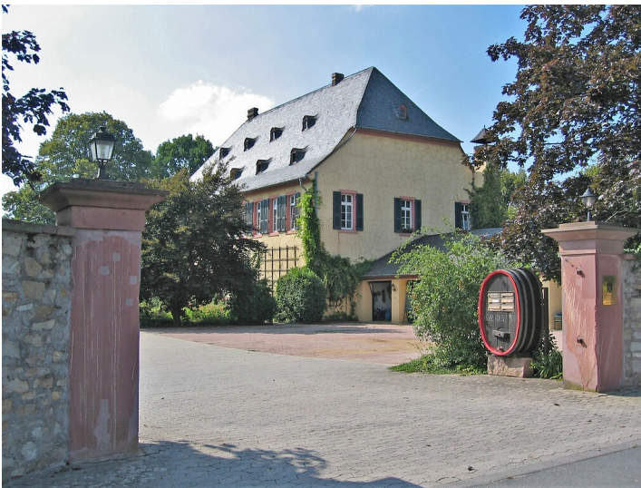
Draiser Hof in Eltville (2005)