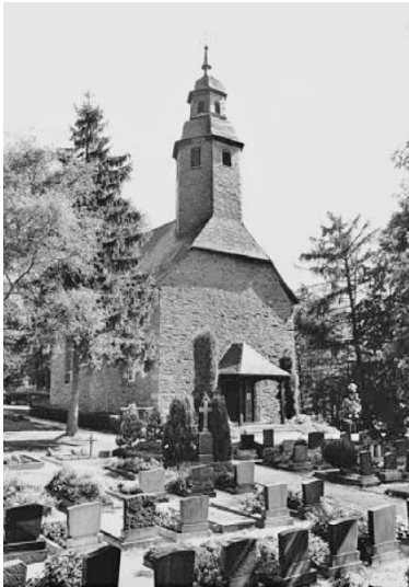
Kirche auf dem Altenberg Fotograf/Urheber: Krienke, Christine