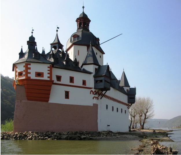
Gesamtansicht der Burg Pfalzgrafenstein bei Kaub von Süden (2009).