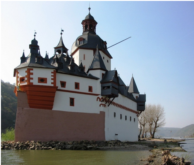
Gesamtansicht der Burg Pfalzgrafenstein bei Kaub von Süden (2009).