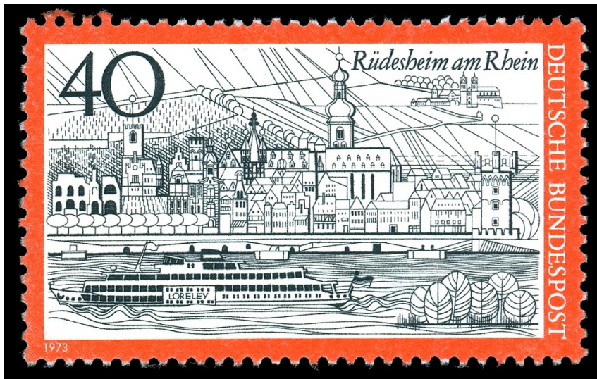
Schematische Darstellung der Stadtsilhouette von Rüdesheim am Rhein auf einer Briefmarke der Serie "Fremdenverkehr" der Deutschen Bundespost von 1973. Auf dem Rhein fährt ein "Loreley" benanntes Ausflugsschiff.