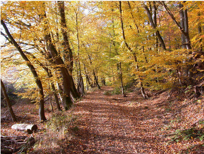
Grenzweg, Eberbach