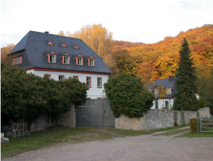
Geishof, Eberbach