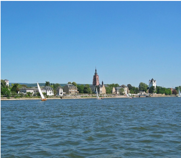
Blick vom Rhein auf Eltville