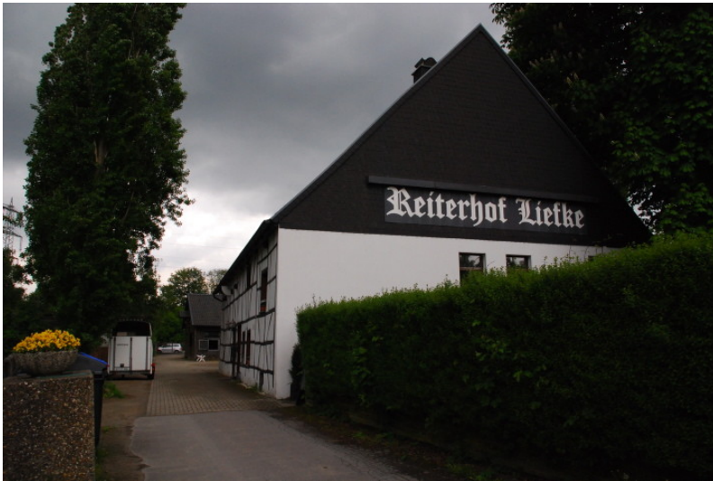
Flur Westerbruch