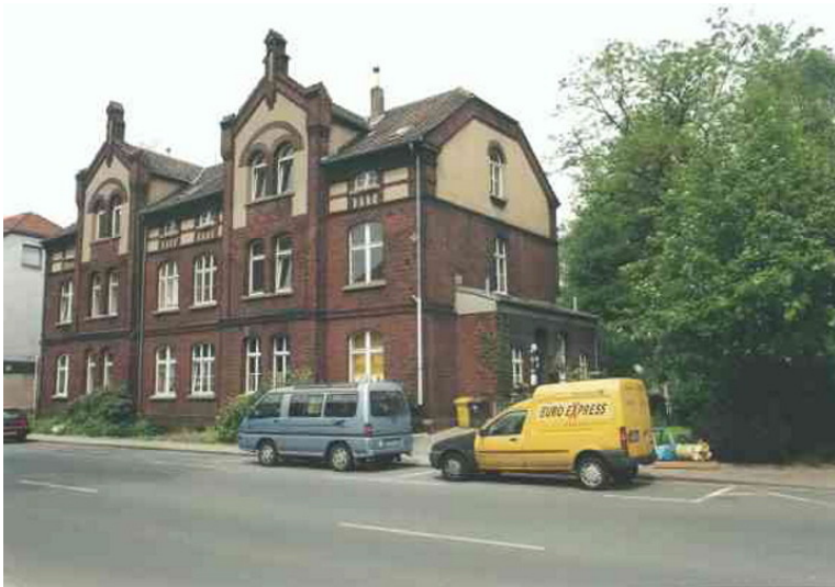
Gebäude in der Ückendorferstraße 71a-73a, Siedlung Kolonie III in Essen-Katernberg (2010)