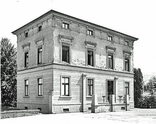
Wohnhaus August-Thyssen-Straße 13-14 (Stadt Essen Baudenkmal Nummer 251) in Essen Kettwig