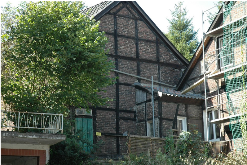
Fachwerkhaus Corneliusstraße 65 (Stadt Essen, Baudenkmal Nummer 594) in Essen Kettwig