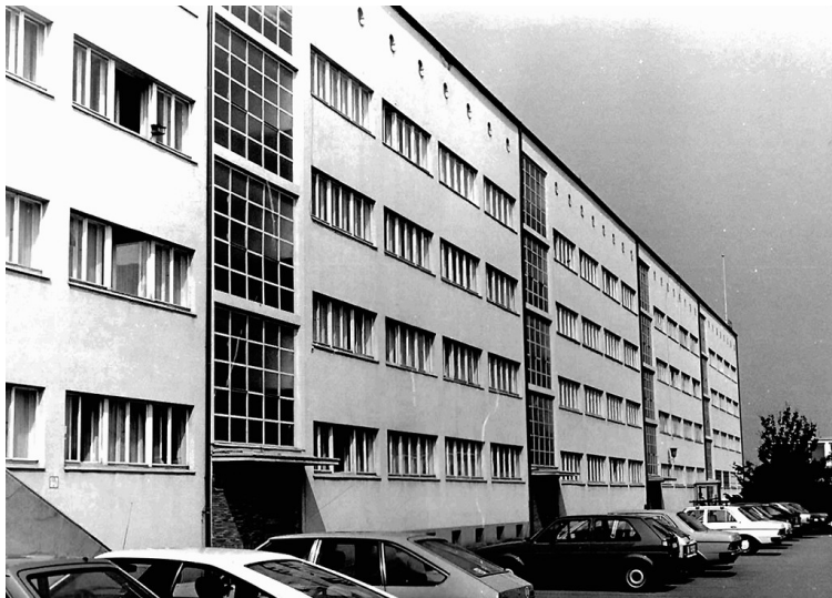
Ansicht der Landespolizeischule in der Norbertstraße in Essen-Bredeney (um 1985).