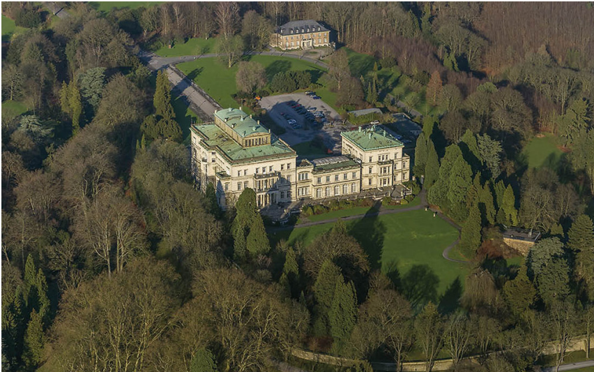
Villa Hügel in Essen-Bredeney (2018)

Schlagwörter: Landschaftsgarten , Fabrikantenvilla Fachsicht(en): Kulturlandschaftspflege, Denkmalpflege Gemeinde(n): Essen (Nordrhein-Westfalen) Kreis(e): Essen (Nordrhein-Westfalen) Bundesland: Nordrhein-Westfalen