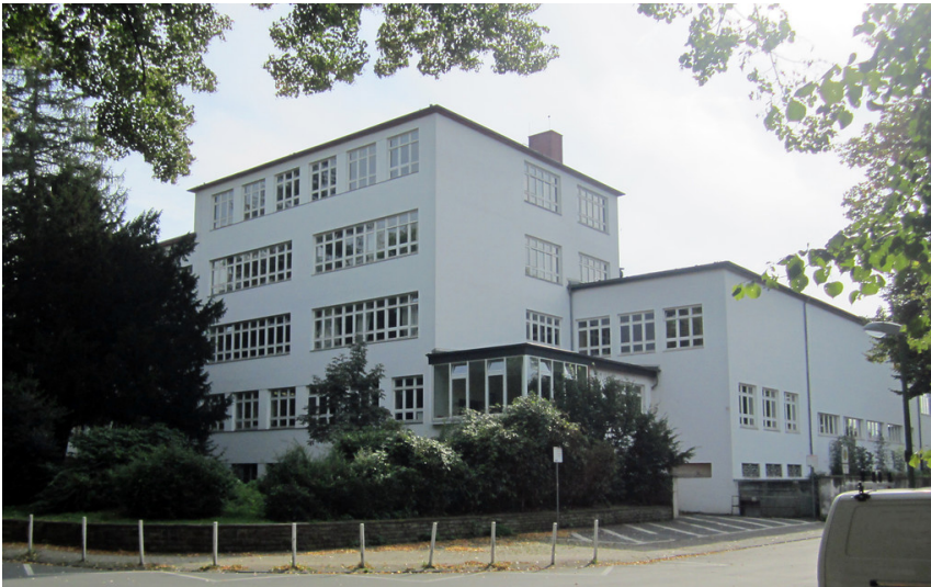
Ansicht des Hauptgebäudes der Grashofschule in Essen-Bredeney (2012).