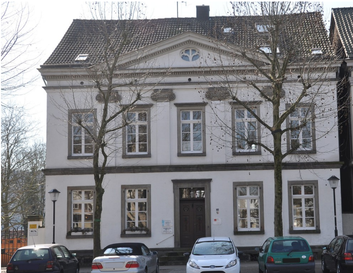
Wohnhaus Hauptstraße 75 in Essen Kettwig