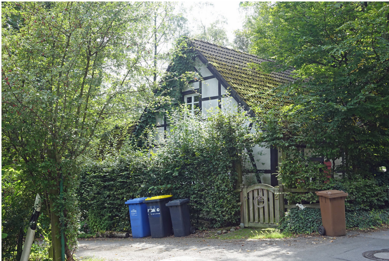
Druckskotten (2017)