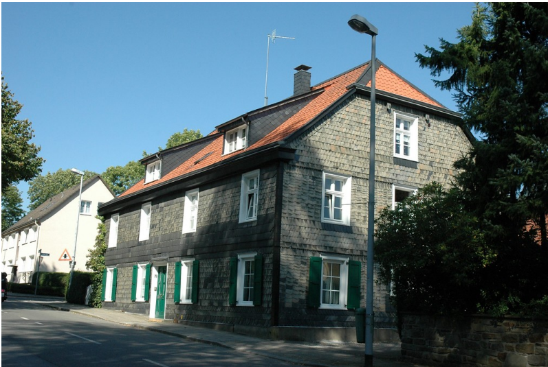
Hof Reckmann (Stadt Essen Baudenkmal Nummer 178,) Corneliusstraße 78, Essen Kettwig