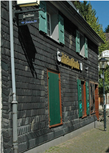
Gasthaus "Brückenschenke" (Stadt Essen Baudenkmal Nummer 175), Am Mühlengraben 2 in Essen Kettwig